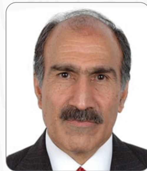
سعادة الدكتور عبدالعزيز أبل