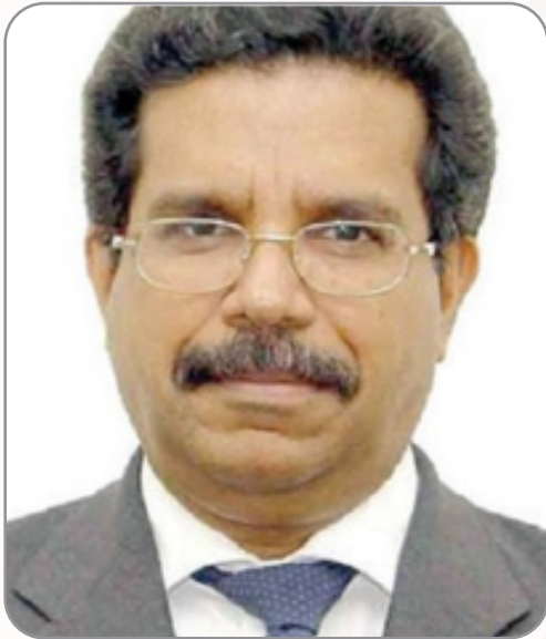
سعادة الدكتور عبدالله الصادق