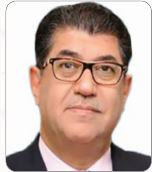
سعادة السيد جمال فخرو