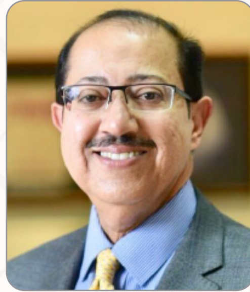
سعادة السيد خالد المسقطي