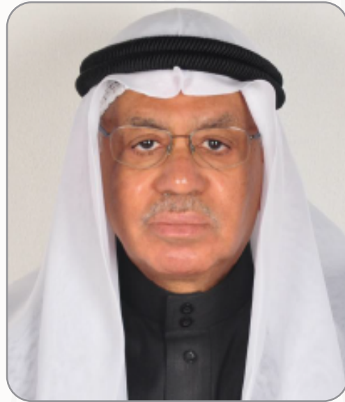
سعادة الدكتور ناظم الصالح