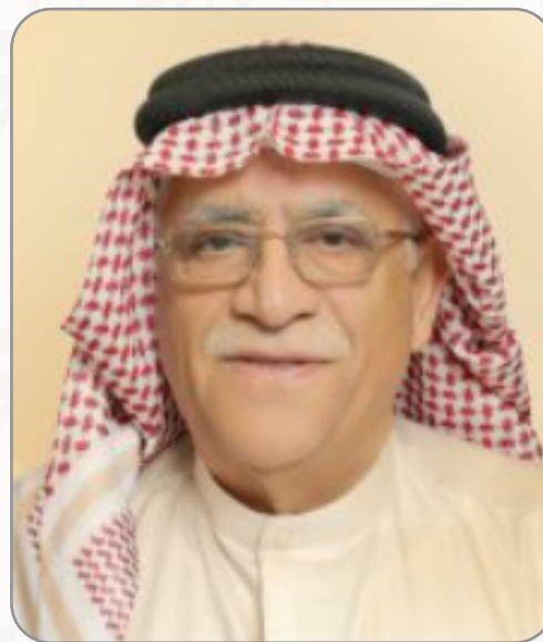
سعادة النائب يوسف زينل