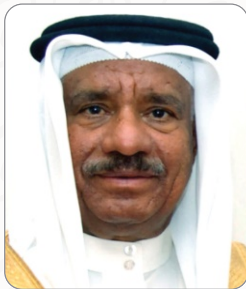
سعادة السيد عبدالرحمن جمشير

محور الجوانب الحقوقية والقانونية والتشريعية