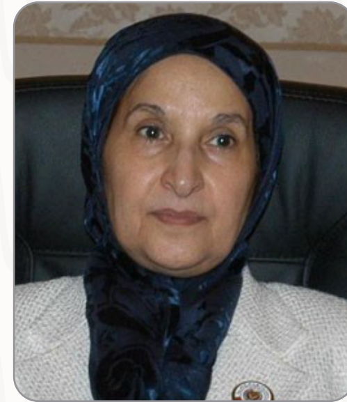
سعادة الدكتورة الشيخة مريم بنت حسن آل خليفة