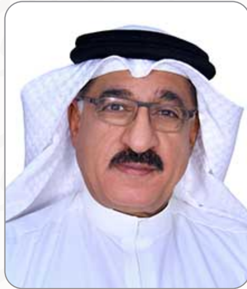
سعادة البروفسور عبدالله الحواج

محور حقوق المرأة والجوانب الإعلامية والأكاديمية