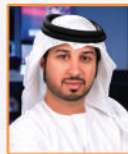
فيصل بن حريز قناة سكاى نيوز العربية