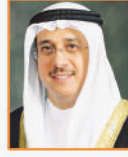
نبيل الحمر مستشار جلالة الملك لشؤون الإعلام رئيس مجلس أمناء معهد البحرين للتنمية السياسية