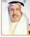
سامي النصف وزير الإعلام والمواصلات السابق - دولة الكويت