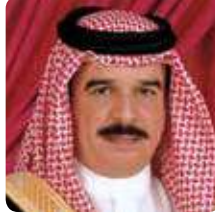
حضرة صاحب الجلالة الملك حمد بن عيسى آل خليفة