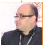
حسام السكري الرئيس السابق لكل من BBC وياهو في الشرق الأوسط