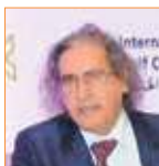
عثمان العمير ناشر ورئيس تحرير صحيفة (إيلاف) الإلكترونية