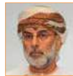
سيف المسكري الأمين العام الأسبق - الشؤون السياسية بمجلس التعاون لدول الخليج العربي