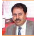
عبدالعزیز الخميس رئيس تحرير جريدة العرب اللندنية