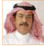
سلطان البازمي مستشار إعلامي ورئيس مجلس إدارة الجمعية العربية السعودية للثقافة والفنون