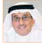
نبيل الحمر مستشار جلالة الملك لشؤون الإعلام رئيس مجلس أمناء معهد البحرين للتنمية السياسية