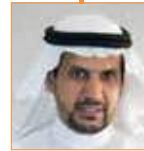
د. ماجد التركي رئيس مركز الإعلام والدراسات العربية - الروسية