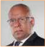
حسن معوض مقدم برامج حوارية قناة العربية