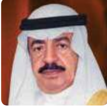
صاحب السمو الملكي الأمير خليفة بن سلمان آل خليفة