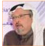
جمال خاشقجي مدير عام ورئيس تحرير قناة (العرب) الفضائية