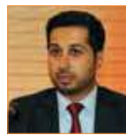
فيصل بن حريز قناة سكاى نيوز عربية