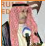
سامي النصف وزير الإعلام والمواصلات الأسبق دولة الكويت