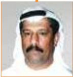
د. علي الشعيبي أكاديمي ومستشار إعلامي الإمارات العربية المتحدة