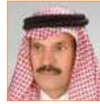
خالد المالك رئيس تحرير صحيفة الجزيرة السعودية