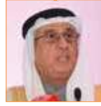
نبيل الحمير مستشار جلالة الملك لشؤون الإعلام رئيس مجلس أمناء معهد البحرين للتنمية السياسية