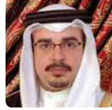
صاحب السمو الملكي الأمير سلمان بن حمد آل خليفة

ولى العهد نائب القائد الأعلى النائب الأول لرئيس مجلس الوزراء