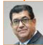
جمال فخر النائب الأول لرئيس مجلس الشورى مملكة البحرين