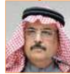
خليل الزوايدي الأمين العام المساعد جامعة الدول العربية