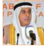
نبيل الحمير مستشار جلالة الملك لشؤون الإعلام رئيس مجلس أمناء معهد البحرين للتنمية السياسيّة