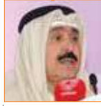
أحمد عبد العزيز الجار الله رئيس تحرير جريدة (السياسة) الكويتية