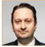
نارت بوران مدير عام قناة سكاي نيوز عربية