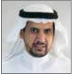
د. ماجد التركي رئيس مركز الإعلام والدراسات العربيّة - الروسيّة