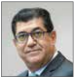
جمال فخرّو النائب الأوّل لرئيس مجلس الشورى مملكة البحرين