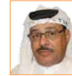
غانم السليبي من رواد الحركة الثقافية الخليجية