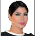
سميرة عبدالله مقدمة أخبار وبرامج سياسية قناة الراي