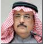
خليل الزوادي الأمين العام المساعد جامعة الدول العربية