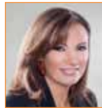
جيزال خوري مقدّمة برامج حوارية قناة BBC عربي