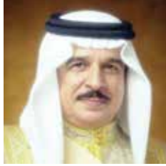
حضرة صاحب الجلالة الملك حمد بن عيسى آل خليفة ملك مملكة البحرين المنذرى