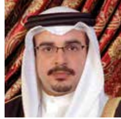
صاحب السمو الملكي الأمير سلمان بن حمد آل خليفة ولي العهد نائب القائد الأعلى النائب الأول لرئيس مجلس الوزراء