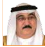
د. محمد عبدالغفار وزير الإعلام الأسبق مملكة البحرين