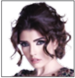
نادين البدر مقدمة برنامج إتجاهات قناة روتانا خليجية