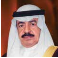
صاحب السمو الملكي الأمير خليفة بن سلمان آل خليفة رئيس الوزراء الموقر