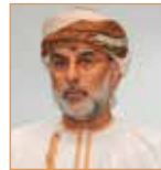
سيف المسكري الأمين العام الأسبق - الشؤون السياسيّة بمجلس التعاون لدول الخليج العربي