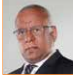
حسن معوّض مقدّم برامج حوارية قناة العربية