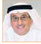
نبيل الحمّر مستشار جلالة الملك لشؤون الإعلام رئيس مجلس أمناء معهد البحرين للتنمية السياسيّة