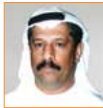
د. علي الشعيبي أكاديمي ومستشار إعلامي الإمارات العربية المتحدة