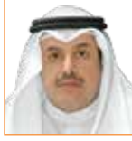
د. سعد بن طفلة وزير الإعلام الأسبق دولة الكويت