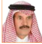
خالد المالك رئيس تحرير صحيفة الجزيرة