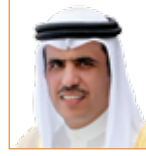
علي الزمبحي وزير شؤون الإعلام رئيس مجلس أمناء معهد البحرين للتنمية السياسية